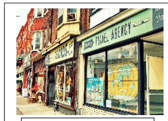
IATA Travel Agent