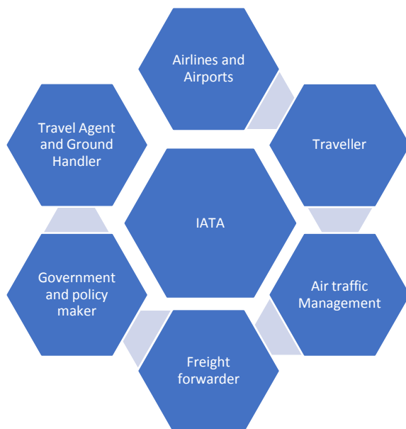
चित्र 1: IATA का सहयोग और जुड़ाव

संतोषजनक ग्राहक अनुभव के प्रयासों को विनियमित करने के लिए विभिन्न मानकों, प्रथाओं और प्रक्रियाओं के विकास में मदद करते हुए, यह निकाय बड़ी तेजी से विकसित हुआ है। आईएटीए के प्रमुख सहयोगियों पर संक्षिप्त चर्चा नीचे दी गई है।