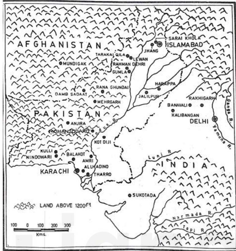
मानचित्र 5.1: प्रारम्भिक हड़प्पा के स्थल, ईएचआई-02, खंड 2।

सिंधु घाटी का निचला हिस्सा, एक समृद्ध क्षेत्र के रूप में प्रसिद्ध था और इसे सिंधु दर्शाता है। यहाँ मोहनजोदड़ों लरकाना जिले में स्थित है। ऊपरी सिंधु में सुक्कुर पहाड़ियाँ स्थित हैं, जहाँ अनेक कामगारों की बस्तियाँ चकमक (chert) खादानों के क्षेत्र के आसपास मिली हैं। चकमक (Chert) हड़प्पावासियों के लिए एक महत्वपूर्ण सामग्री थी, जो की ब्लेड बनाने के काम आती थी। ब्लूचिस्तान का पश्चिमी क्षेत्र एक विविधतापूर्ण भूभाग था जिसका उस काल में इस्तेमाल किया जा रहा था। मकरान के तटीय क्षेत्र में सुतकागनदोर व सोतकाकोह जैसे स्थल स्थापित हुए, जो कि सिंधु सभ्यता, फारस की खाड़ी व मेसोपोटामिया के बीच समुद्री व्यापार में एक महत्वपूर्ण भूमिका का निर्वाहन करते थे। इन स्थलों से आंतरिक मार्ग भीतरी प्रदेशों में जाते थे। ब्लूचिस्तान की अन्य बस्तियाँ अत्यंत महत्वपूर्ण मार्गों पर और कृषि योग्य क्षेत्रों में स्थित थी। इन महत्वपूर्ण मार्गों के द्वारा ब्लूचिस्तान का तांबा, सीसा, अन्य अर्ध कीमती पत्थर (लाजवर्द, फिरोजा) को सिंधु घाटी की बस्तियों तक पहुंचाया जा सकता था।