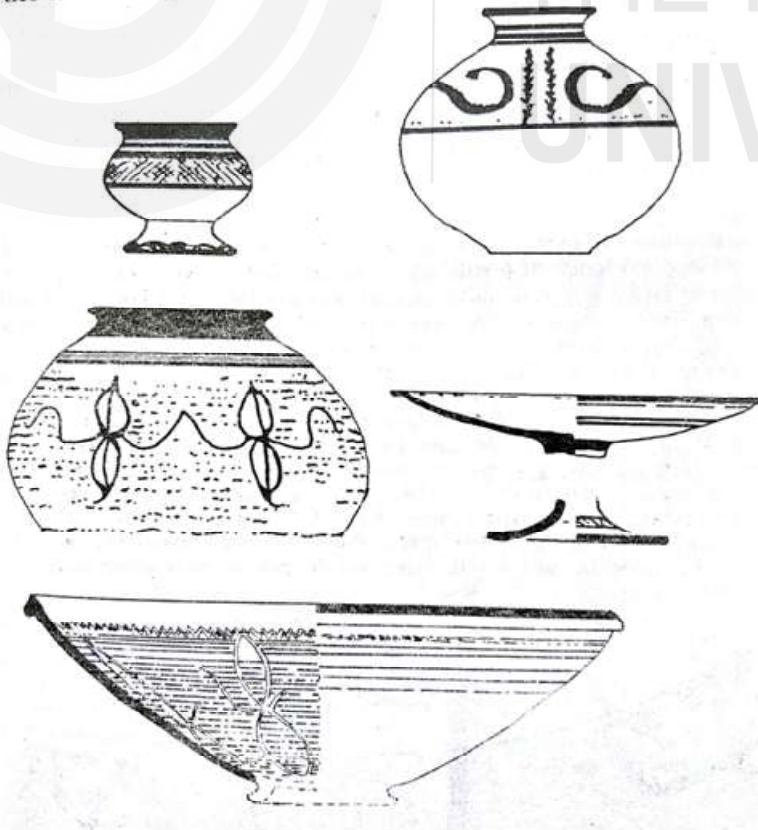
चित्र 5.2: प्रारम्भिक सिंधु कालीन मृदभाड़ : कालीबंगन। स्रोत: ईएचआई-02, खंड-2

हरियाणा क्षेत्र सोथी-सीसवाल संस्कृति से समृद्ध है। सीसवाल के अलावा, ये चरण कुनाल, बालू, बनावली, राखीगढ़ी व भीराना में पाया गया है। लगभग इन सभी स्थलों से मिट्टी के ईंटों से बनी संरचनाओं के प्रमाण मिले हैं। कुनाल में ईंटों का अनुपात 1:2:3 तथा 1:2:4 का है तथा भीराना में अनुपात 1:2:3 का है। कुनाल में प्रारम्भिक हड़प्पा स्थल का क्षेत्रफल लगभग एक हेक्ट. था। यहाँ हमारे पास दो प्रारम्भिक हड़प्पा संस्कृतियाँ IB व IC हैं। IB का वर्गीकरण इसमें मिले सोथी बर्तनों के आधार पर प्रारम्भिक हड़प्पा काल में किया गया है। किंतु इस अवधि में कोई भी ईंटों से बनी संरचना नहीं थी। ईंटों के बजाय यहाँ के लोग नरकुल और मिट्टी (wattle and Daub) से बने संरचनाओं में रहते थे। अगले चरण IC में ईंटों के मकान दिखाई देते हैं, जिनमें ईंटों का अनुपात 1:2:4 या 1:2:3 होता था। घर से कूड़े के डिब्बे व जार भी प्राप्त हुये हैं। इस चरण का एक महत्वपूर्ण खोज, सोने व चांदी के आभूषणों का संग्रह जो लाल रंग के बर्तन में मिला है। साथ ही लाजवर्द के छोटे मनकों, 92 गोमेद के मनके व प्रकाचित मिट्टी से बनी व कार्नेलियन मोतियों के बड़े भंडार/संग्रह