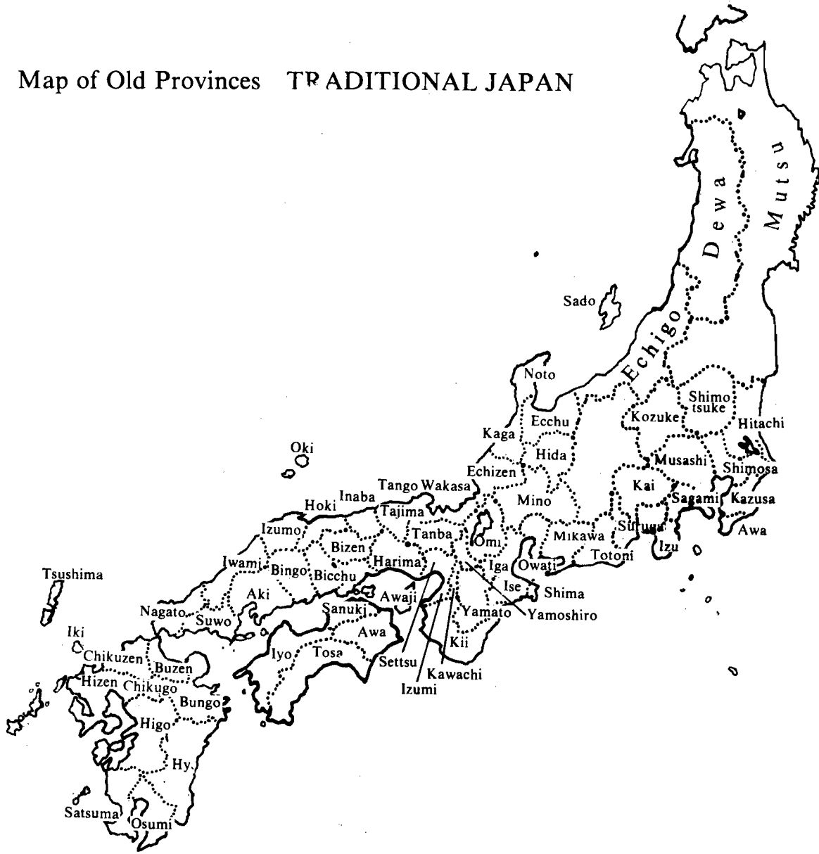
नक्शा-2 : जापान के पुराने प्रांत