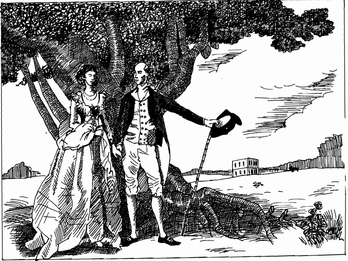
7 भारत में वारेन हेस्टिंग्स

यह दृष्टिकोण प्राच्यवादियों के दृष्टिकोण के रूप में जाना जाता है और वारेन हेस्टिंग्स के अलावा और लोग भी इसके समर्थक थे।