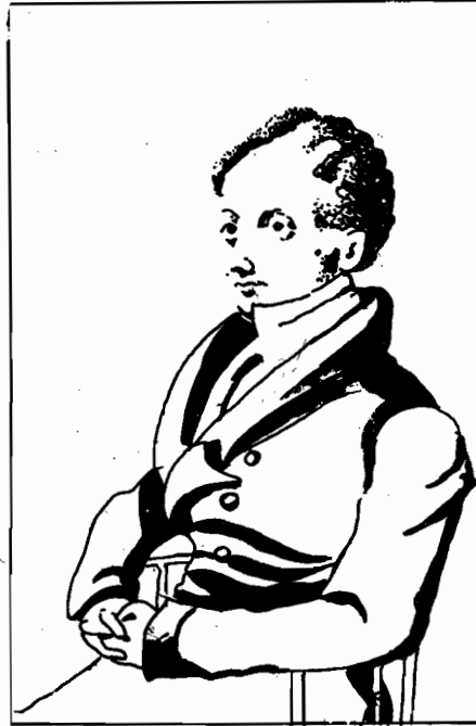
12 जेम्स मिल

डलहौज़ी के नेतृत्व में साम्राज्य का दृढीकरण हुआ, इसमें भारत संबंधी ब्रिटिश धारणा के अंतर्विरोध स्पष्ट रूप में उभर कर सामने आये। डलहौज़ी ने जेम्स मिल की धारणा को और आगे बढ़ाया तथा उसने देशी भारतीय राज्यों के प्रति आक्रमणकारी रुख अपनाया। इसके अतिरिक्त बेंथमवादी परम्परा का पोषण करते हुए उसने एक उच्चाधिकारी के नेतृत्व में अखिल भारतीय विभागों, मसलन डाक और तार विभाग, जन कार्य विभाग आदि की स्थापना की। इन विभागों की स्थापना करके वह एकीकृत अखिल भारतीय साम्राज्य के ढाँचे में कुशल प्रशासन की अवधारणा को अंजाम देना चाहता था। यह व्यवस्था मुनरो की भारत संबंधी धारणा के बिल्कुल विपरीत थी, जिसमें क्षेत्रीय राज्यों के एक ढीले संघ की बात की गयी थी।