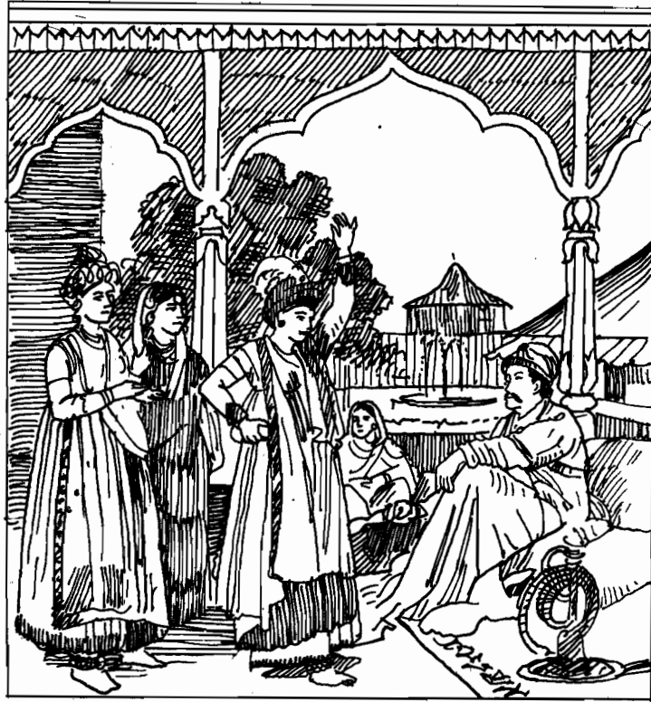
9 नृत्य देखते हुए भारतीय परिवेश में कर्नल पोलियर

पर अपनी स्थिति को मजबूत करने के लिए और एक अधिक सक्षम प्रशासनिक ढाँचा कायम करने के लिए अंग्रेजों के लिए कानून तथा भूमि संबंधी संपत्ति जैसी भारतीय संस्थाओं को जानना जरूरी था। इसी समय ब्रिटेन में औद्योगिक क्रांति हुई और ब्रिटेन से बाहर बाजार और कच्चे माल की खोज शुरू हो गई। वहाँ के उद्योगपतियों की इन जरूरतों का भी ब्रिटेन के नीति निधारकों को ध्यान रखना था।