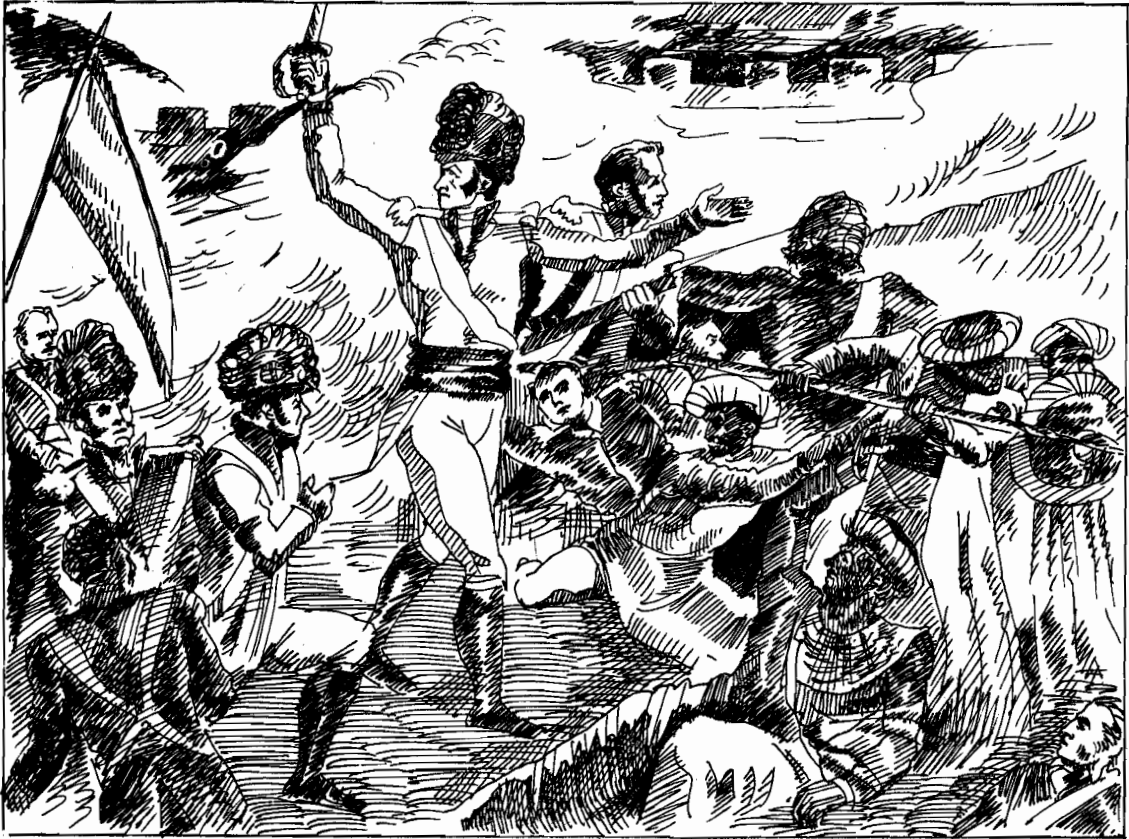
5 श्री रंगपट्टनम पर कब्जा करते हुए अंग्रेज