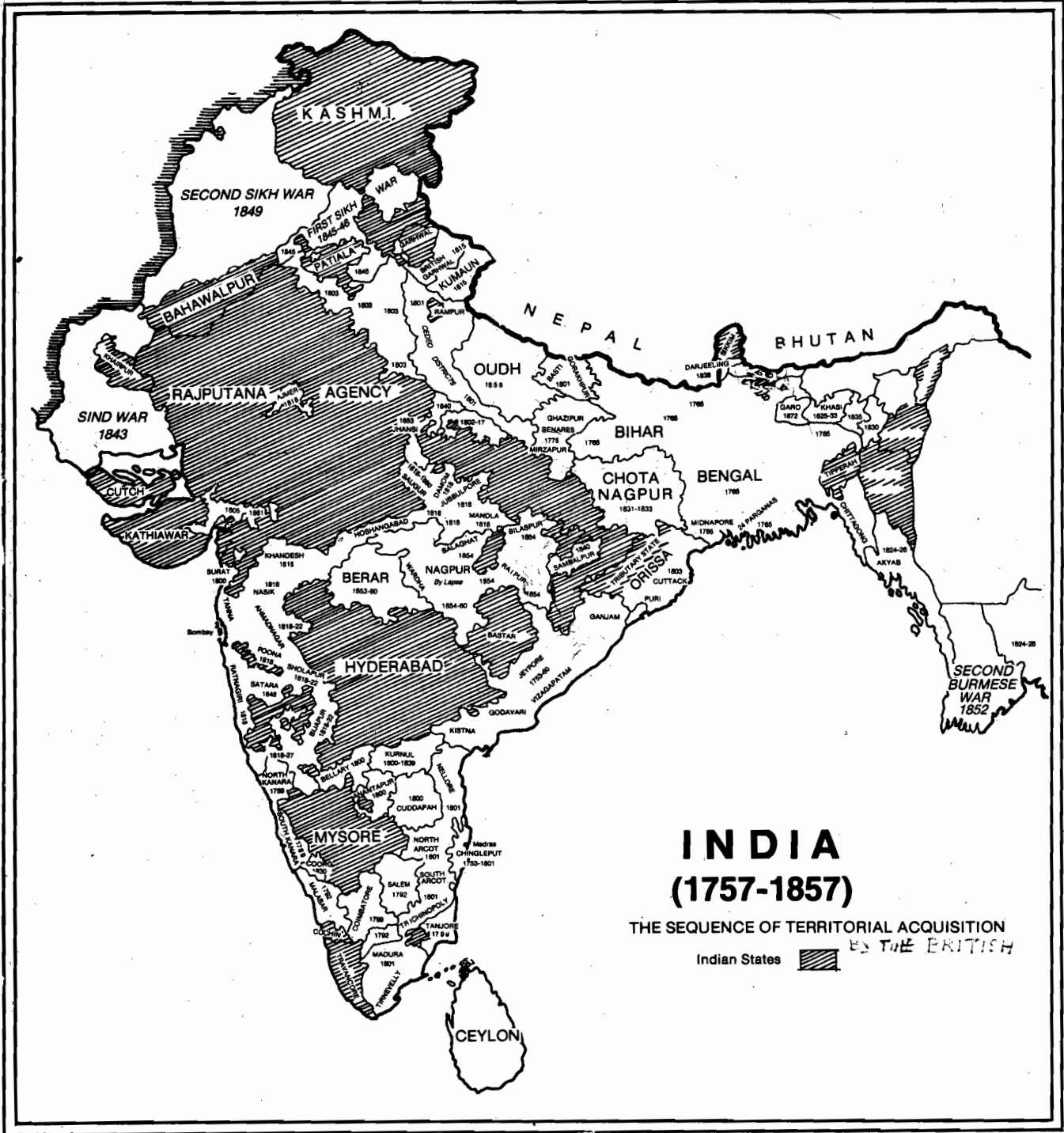
मानचित्र 1 भारत (1757-1857)

पर दक्कन में वर्चस्व स्थापित करने की प्रतिस्पर्धा का यह कोई अंतिम हल नहीं था। यह अंतिम प्रहार के पहले की शांति थी। युद्ध का होना अपरिहार्य था। 1786 में लार्ड कार्नवालिस भारत का गवर्नर जनरल बनकर भारत आया और उसने अपनी कूटनीतिक क्षमता के बल पर मराठों और निजाम को अपने पक्ष में कर लिया। टीपू ने अंग्रेजों के मित्र त्रावणकोर पर हमला किया, अब अंग्रेजों के साथ युद्ध अपरिहार्य हो गया। युद्ध 1790 में शुरू हुआ और यह दो वर्षों तक चला। तृतीय मैसूर युद्ध में टीपू को हार का सामना करना पड़ा और उसने संधि का प्रयत्न किया। 1792 में श्रीरंगपट्टनम की संधि पर हस्ताक्षर किया गया और इसके तहत टीपू को अपने राज्य का आधा हिस्सा अंग्रेजों और उसके सहयोगियों को दे देना पड़ा। टीपू अंग्रेजों के सामने समर्पण करने के लिए तैयार नहीं था, पर तृतीय मैसूर युद्ध ने उसकी कमर तोड़ दी और दक्कन पर उसकी पकड़ कमजोर हो गयी।