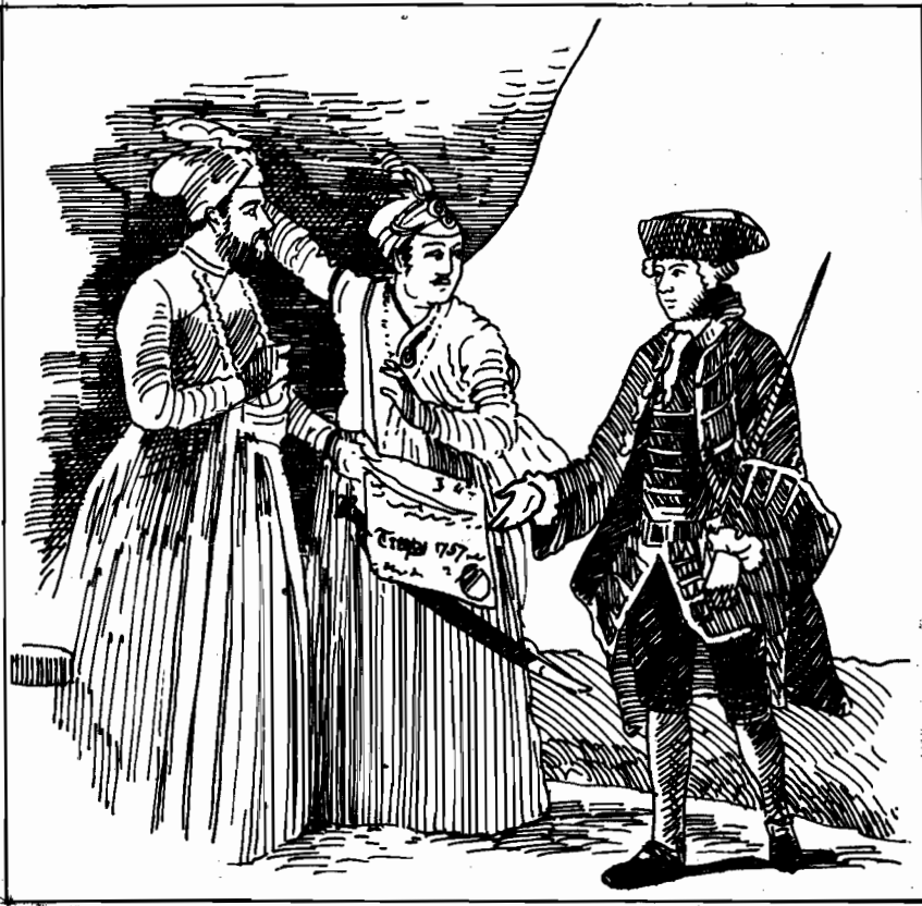
1 अंग्रेजों तथा मीर जाफर और उसके पुत्र मीरान के मध्य 1757 की संधि

रबर्ट क्लाइव के नेतृत्व में मद्रास से शक्तिशाली अंग्रेज सेना के कलकत्ता पहुँचने से बंगाल में अंग्रेजों की स्थिति और मजबूत हो गई। कंपनी का नवाब के दरबार के षडयंत्रकारियों के साथ गठबंधन हो जाने से कंपनी की स्थिति और मजबूत हो गई। इसलिए अंग्रेजों की विजय प्लासी के लड़ाई के मैदान (जून, 1757) में होने वाले युद्ध में पूर्व ही सुनिश्चित हो गई थी। यह विजय कंपनी की सैनिक शक्ति की श्रेष्ठता के बल पर नहीं अपितु नवाब के अधिकारियों द्वारा षडयंत्र में मदद करने के कारण प्राप्त हुई। निश्चय के साथ यह कहना बड़ा मुश्किल है कि सिराज उचित कार्यवाही करने में क्यों असफल हुआ। अंततः वह स्वयं को भी न बचा सका और मीर जाफर के पुत्र मीरान ने उसका कल कर दिया।